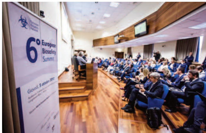
Un momento dei lavori del 6° European Biosafety Summit