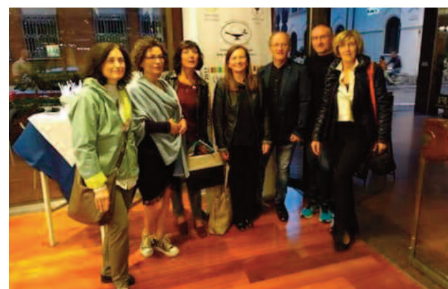
I colleghi della segreteria organizzativa di CNAI Ravenna